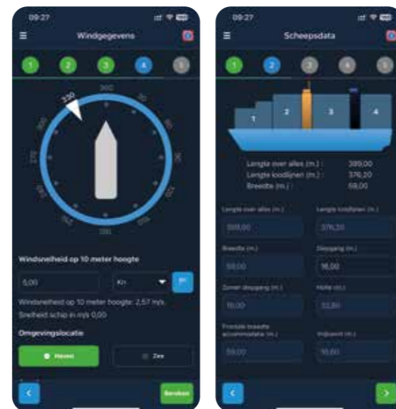
Schermafbeeldingen van de Windload app