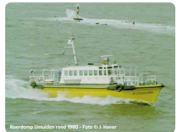
Roerdomp IJmuiden rond 1980