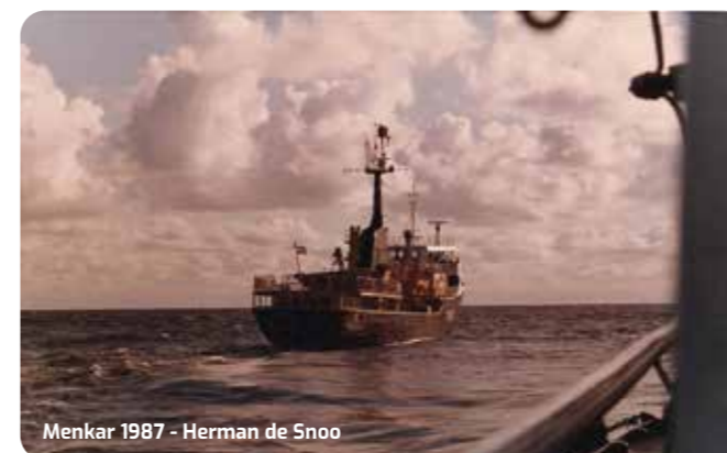
Menkar 1987 - Herman de Snoo