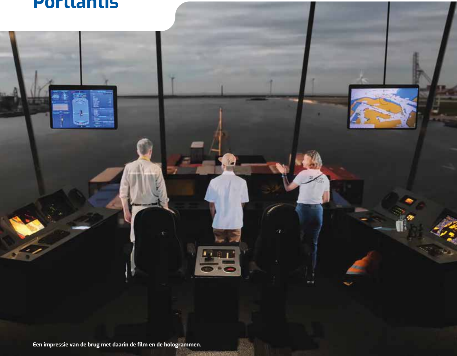
Een impressie van de brug met daarin de film en de hologrammen.

“De haven is enorm belangrijk voor iedereen in Nederland maar dat weten de meeste mensen niet. Daarnaast biedt de haven veel leuk werk maar dat is ook vaak niet bekend.”