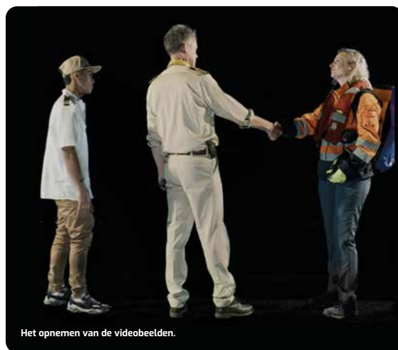
Het opnemen van de videobeelden.

“De haven is enorm belangrijk voor iedereen in Nederland maar dat weten de meeste mensen niet. Daarnaast biedt de haven veel leuk werk maar dat is ook vaak niet bekend.”