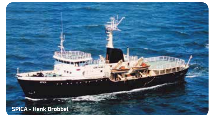
SPICA - Henk Brobbel